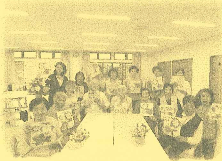
ふれあい・いきいきサロン

自治会単位など住み慣れた地域で、高齢者や障がい者がいきいきと暮らすための支援費として（76グループ）