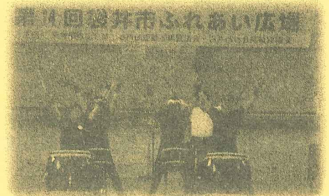
ふれあい広場の開催

子どもからお年寄り、障がい者等が集まり、レクリエーション等を通じて相互の交流・理解を深めるための事業開催費として