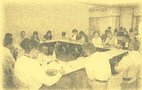
地域福祉推進組織

市内14コミュニティセンター単位で組織され、地区ごとに多様な事業を展開するための支援費として