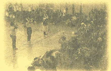
袋井市社会福祉大会の開催

市内14コミュニティセンター単位で組織され、地区ごとに多様な事業を展開するための支援費として