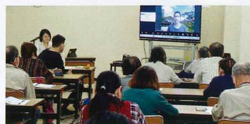
昨年の講演会の様子