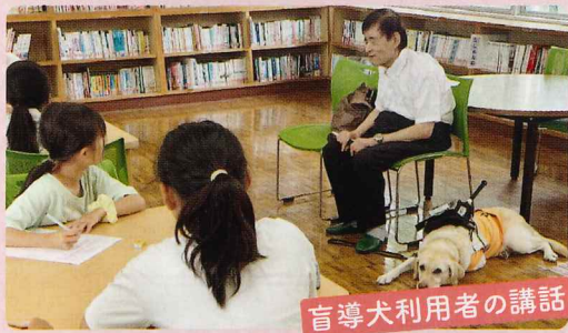
盲導犬利用者の講話