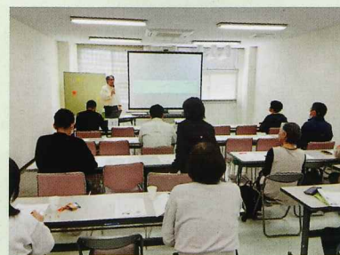
コミュニケーションについての講話の様子

今年度から公認心理師によるカウンセリングを年4回実施しています。ご本人やご家族から「じっくり話を聞いてもらった。今のままでよいことやアドバイスを聞いて良かった」などの感想が寄せられ、焦りや不安を抱える相談者の安心や自己肯定感を高めることにつながっています。