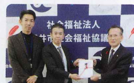
浜松いわた信金 店別対抗 チャリティーゴルフ大会 様より