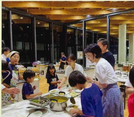
寄贈いただいた食材は、市内のこども食堂や生活にお困りの世帯への一時的な支援に活用しています。

20社を超える企業から協力の申し出をいただいています。(※企業登録は随時受け付けています)