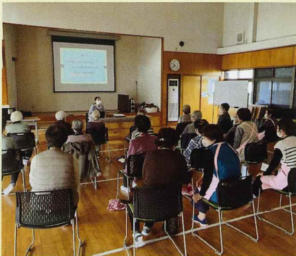
薬剤師が講師として協力してくださいました。