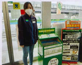
ファミリーマート様

スーパーマーケットバロー様(袋井南店・袋井店)、ファミリーマート様(国本店・新池店・浅名店)より、社会貢献活動として、生活困窮者及び子ども食堂を対象とした食糧提供(フードドライブ)を実施することとなりました。今後も、様々な企業にご協力をいただき、このような生活困窮支援等に力を入れ、取り組んでいきたいと思っております。