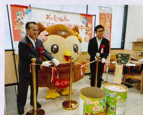
スーパーマーケットバロー様