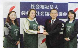
袋井商工会議所 女性会 様より