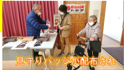
見守りバッジが配布され