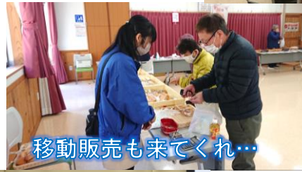
移動販売も来てくれ...

令和4年3月3日のひなまつりに豊沢ふれあい会館で認知症に関する講演会を開催しました。