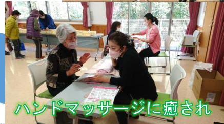
ハンドマッサージに癒され