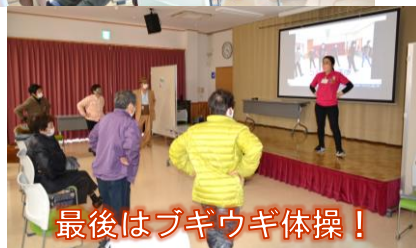
最後はブギウギ体操!

教えていただきました。参加者から、分かりやすかった!と嬉しい声が沢山届きました。