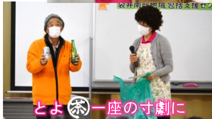
とよ茶一座の寸劇に

大田連合会長が寅さんに扮して認知症に関する疑問を投げかけ、包括職員が説明しました。また、とよ茶一座