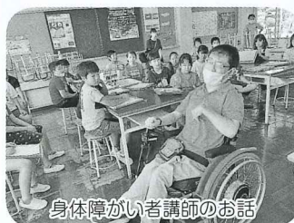
身体障がい者講師のお話