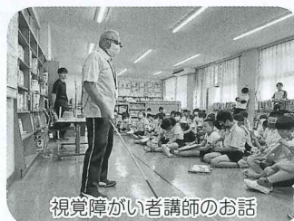
視覚障がい者講師のお話