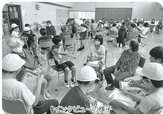
インタビューの様子

地域に住むすべての人が、幸せに暮らすことができるまちにしていきたいため、福祉教育を推進していきます。