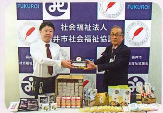
ダイナム静岡袋井店様より