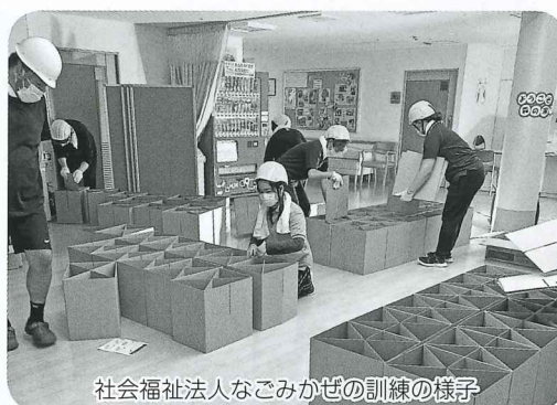
社会福祉法人なごみかぜの訓練の様子

各法人が作成しているBCP（発災時に事業を継続するための計画）の充実のため、勉強会や法人間の情報共有のシステム構築を行い、より実行性の高いBCPを作成しました。また、地域との発災時の連携のために地域住民の代表がBCPに基づく訓練の見学を行い、防災について理解を深めました。