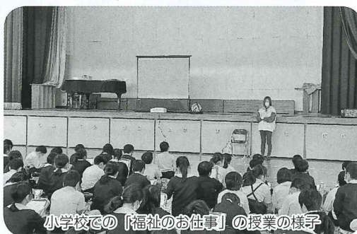
小学校での「福祉のお仕事」の授業の様子

地域に不可欠な「福祉のお仕事」に関わる人材を確保するため、人材確保のパンフレット「このゆびとまれ」の作成や、各法人の職員が講師となり、小中学校で「福祉のお仕事」に関する授業や進路に関する授業を行っています。授業を通じて、施設と学校との新たなつながりが生まれています。