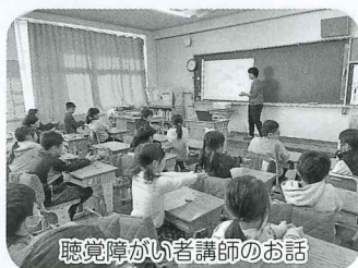
聴覚障がい者講師のお話