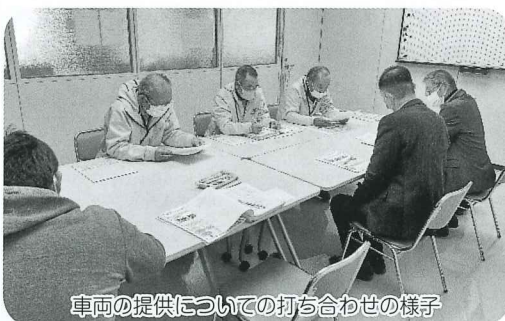
車両の提供についての打ち合わせの様子

市内で住民主体の生活支援活動を行っている団体に対し、近隣の社会福祉法人が移動支援用に車両を調整して提供を行っています。その他、移動販売への協力等、社会福祉法人がそれぞれの地域の実情にあった地域貢献活動を行っています。