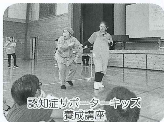
認知症サポーターキッズ養成講座