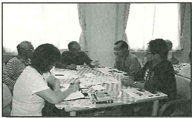
地域福祉推進組織

市内14公民館単位等で組織され、 地区ごとに多様な事業を展開する ための支援費として