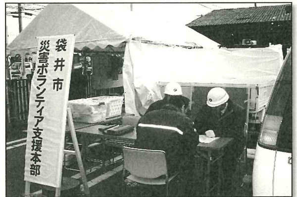
災害対策本部の体制整備

市内小中高等学校(18校)で児童・ 生徒が思いやりの心を育むため の支援費として