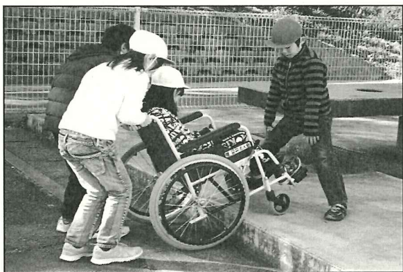
福祉教育実践校事業

市内小中高等学校(18校)で児童・ 生徒が思いやりの心を育むため の支援費として