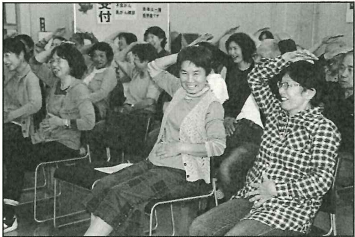
ふれあい・いきいきサロン

自治会単位など住み慣れた地域で、 高齢者や障害者がいきいきと暮らす ための支援費として (71グループ)